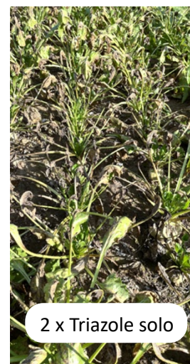
Cercosporiose : AIRONE® Sc confirme son intérêt

Siège France SIPCAM France 14 rue Beffroy 92200 Neuilly sur Seine